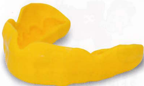
カスタムメイドマウスガード 歯科医院で製作したもの

ヘルメットが頭にピッタリ適合していると、頭をケガなどから守ることができます。お口の中は頭より複雑な形で、さらにかみ合わせも人によって異なっています。